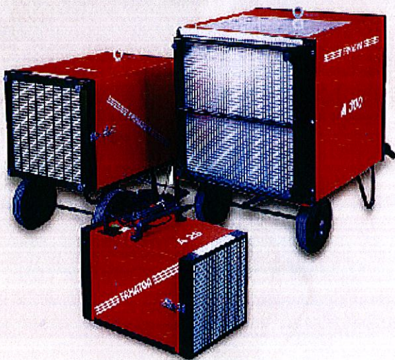
Ermator A300, A100, A25

Ermator-Luftreiniger in einer Türöffnung angeordnet, um die Staubverteilung ausserhalb des Raumes zu vermeiden. Die Türen und Fenster im Raum müssen geschlossen sein.